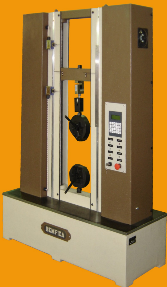
MT 5 MP